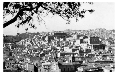
Panorama di Canicattì

Il Tribunale di Bielefeld ha respinto il ricorso (sentenza del 26 settembre 2023, causa n. 1 O 181/22). Dalla pubblicazione di tutti i testi di marketing della città relativi al concorso e anche dalle condizioni di partecipazione era chiaro che si trattava di uno scherzo. Dalle motivazioni: "Secondo l'orizzonte oggettivo del destinatario, il successo richiesto sarebbe stato solo la prova empirica, ovviamente impossibile, dell'inesistenza di Bielefeld. La prova assiomatica all'interno di un sistema assiomatico non era inclusa".