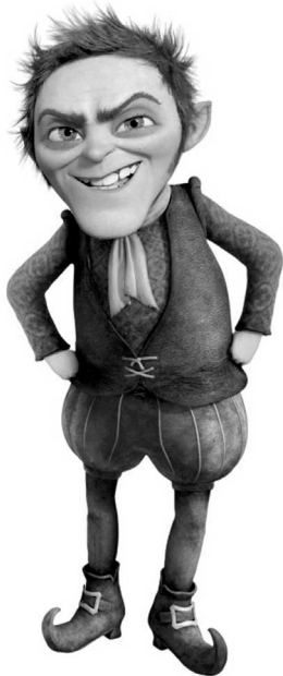
Ein dünnes Rumpelstilzchen

Der Anwalt ließ sich das nicht gefallen und erwirkte eine Verurteilung wegen Beleidigung, gegen die sich die Frau mit einer Verfassungsbeschwerde wehrte, sie sah ihr Grundrecht auf Meinungsfreiheit verletzt. In Deutschland kann, anders als in Italien, jeder, der den Rechtsweg ausgeschöpft hat und sich in einem Grundrecht beschwert fühlt, das Verfassungsgericht anrufen.