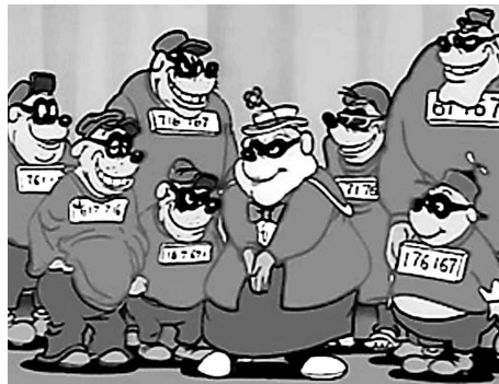
Harvard Law School of 2024

Per inciso, il non-collega potrebbe lavorare ancora oggi se non avesse commesso un errore davvero stupido nel falsificare il suo certificato d'esame. Ha infatti scelto lunedì 25 maggio 2015 come data di rilascio del certificato. Come ogni lunedì dopo Pentecoste, questo era un giorno festivo in Germania. È così che è stato scoperto.